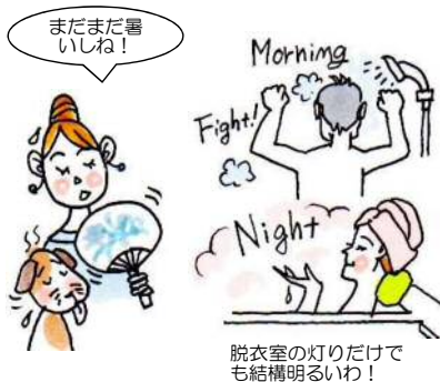
脱衣室の灯りだけで も結構明るいわ!