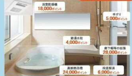
システムバスルーム スパージュ (注)節湯水栓をキッチン、浴室の両方で交換された場合でも、4,000ポイントとなります。