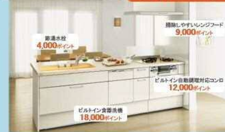
システムキッチン リシェルスI (注)節湯水栓をキッチン、浴室の両方で交換された場合でも、4,000ポイントとなります。