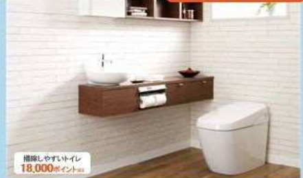
タンクレストイレ サティスGタイプ (注)「節水型トイレ」と「掃除しやすいトイレ」とで重複してのポイント発行申請はできません。